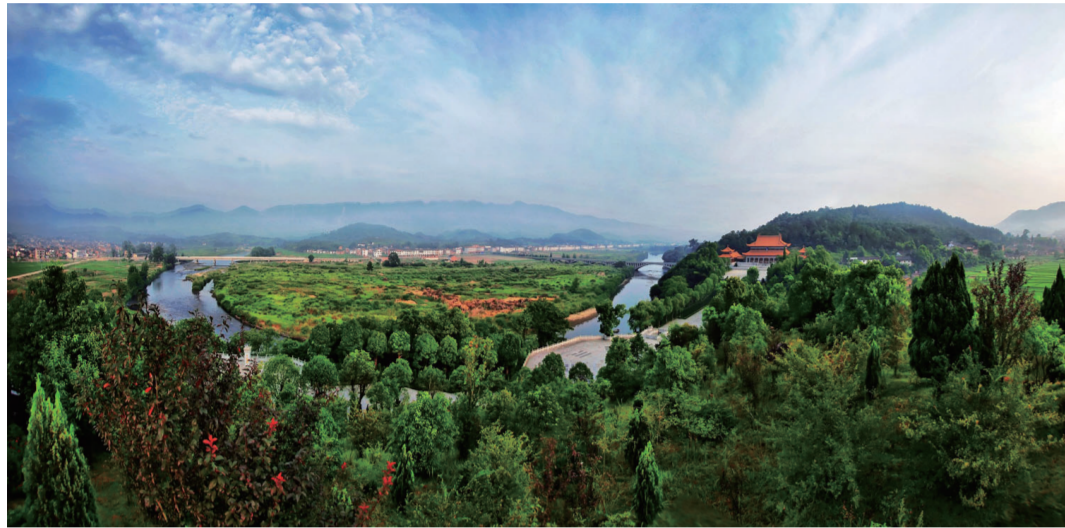
▲炎帝陵风景区(资料图)

近日,由中国国土经济学会推选的“2017百佳深呼吸小城”入围名单在北京发布,我市炎陵县入围。据了解,经过公开征集公众意见和专家进一步评选后,该正式榜单将于5月19日“中国旅游日”当天公布。