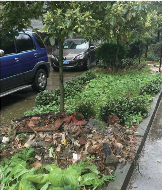
▲绿化带里种满了蔬菜

芋头师傅看了心里暗笑,也不做声,在大棋盘上摆了个《玄玄棋经》里的“龟势”。小土豆的围棋班同学小芦荟拍手叫了起来:“这块棋子看起来象个小乌龟,没精打采的,和小土豆一个样。”芋头师傅笑了起来,小土豆也乐了。芋头师傅说:“这个小乌龟之所以没精打采,是因为它以为被重重包围,爬不出去了。你们帮它想想,看能不能够想个什么办法,帮它爬出去?”小土豆拿棋子摆了一下,摇摇头。小芦荟想得深