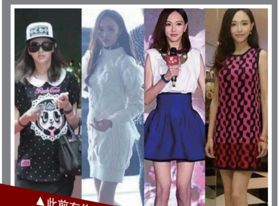
▲此前有传唐嫣和邱泽分手后暴瘦,一双白腿堪比筷子。