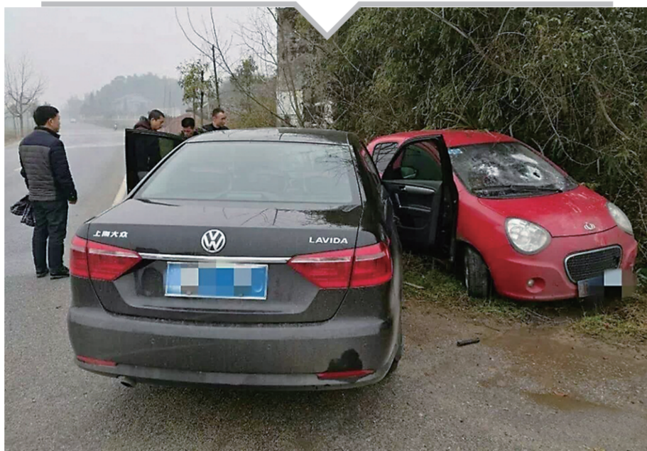
▲嫌疑人的红色小车被民警驾车逼停

车内进行毒品交易时遇民警检查,涉毒人员竟然驾车冲撞民警企图逃跑,经过几番交锋后,被民警逼停在路边。最终,两名涉毒人员被民警抓捕。