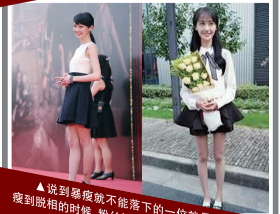
▲说到暴瘦就不能落下的一位就是郑爽。郑爽瘦到脱相的时候,粉丝纷纷劝其增肥。