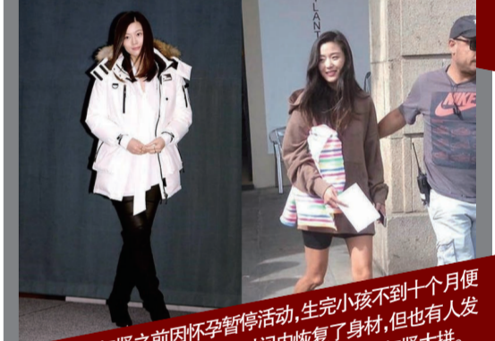
▲全智贤之前因怀孕暂停活动,生完小孩不到十个月便复出拍《蓝色大海的传说》,短时间内恢复了身材,但也有人发现产后暴瘦的全智贤腿上青筋突起,纷纷赞叹全智贤太拼。