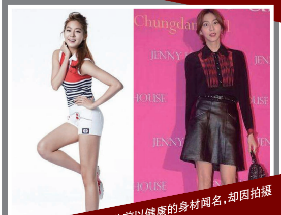
▲韩国艺人Uie此前以健康的身材闻名,却因拍摄压力大导致瘦到脱相。