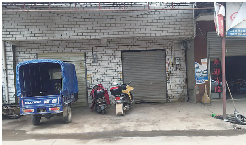
▲修车店大门紧闭,但从卷闸门处仍可见爆炸痕迹