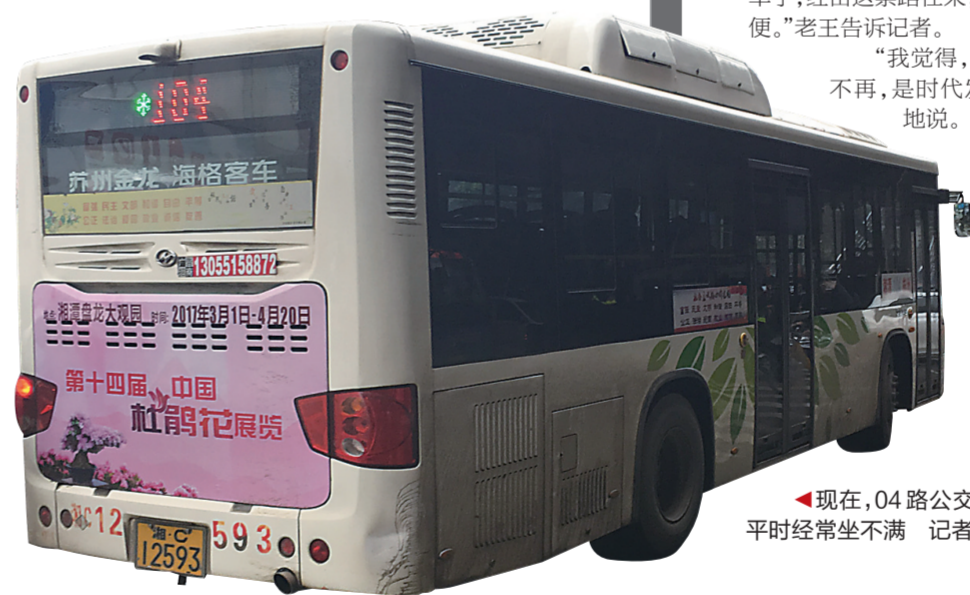
▲现在,04路公交除周末人比较多,平时经常坐不满

102路、104路起步价1元,全程四五元,公交的公益性,受到了大批来往三地的老百姓的追捧。