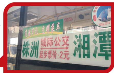
▲2元的起步票价,还是不少低收入人群的选择

兵哥坚持认为,城际公交有继续开下去的必要性。比如说104路,经过霞湾等城市公交覆盖不够的区域,方便了当地居民的出行。