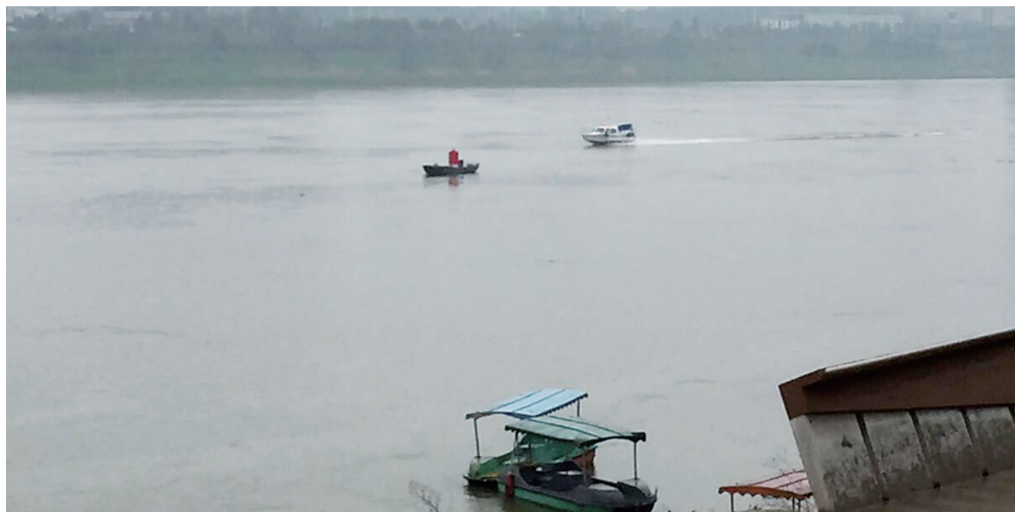
▲执法人员驾快艇追击非法电鱼船

市渔政站昨缴获两艘大功率电打鱼船 发现非法捕鱼行为，请拨举报电话28682363