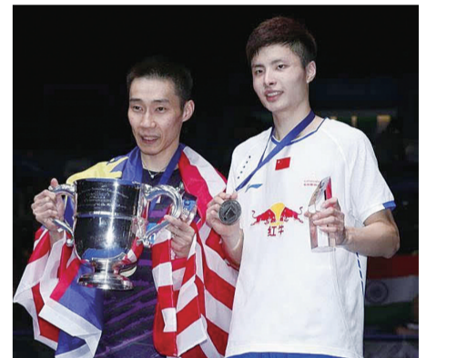
▲李宗伟(左)和中国选手石宇奇在颁奖仪式上

第107届全英羽毛球公开赛12日进行了5个项目的决赛后闭幕,鲁恺和黄雅琼在混双比赛中为中国队赢得唯一一项冠军,小将石宇奇在男单决赛中以0:2不敌马来西亚老将李宗伟,获得亚军,这也是中国队7年来首次无缘单打冠军。