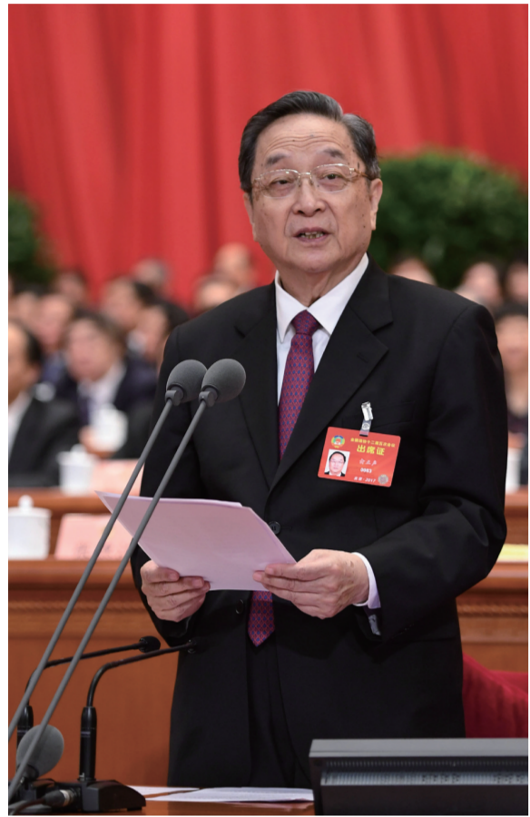
▲俞正声主持闭幕会并讲话

汇聚磅礴力量,共襄复兴伟业。中国人民政治协商会议第十二届全国委员会第五次会议圆满完成各项议程,13日上午在人民大会堂闭幕。会议号召,人民政协各级组织、各参加单位和政协委员,更加紧密地团结在以习近平总书记为核心的中共中央周围,高举中国特色社会主义伟大旗帜,不忘初心、继续携手前进,开拓创新、奋发有为,以优异成绩迎接中共十九大胜利召开,为实现“两个一百年”宏伟目标、实现中华民族伟大复兴的中国梦而努力奋斗。