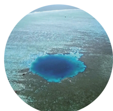
▲海南永乐群岛龙洞奇观

《航拍中国》共五季,以空中视角俯瞰中国,涉及23个省、5个自治区、4个直辖市和2个特别行政区。无论你来自祖国的天南还是地北,在这部片里或许都能找到家乡的影子。 《航拍中国》给了观众一双鸟儿的眼睛,一起俯瞰中国;也让观众深深自豪,960万平方公里的土地,300万平方公里的领海,有那么多美景,都在我们脚下,都在我们身边。