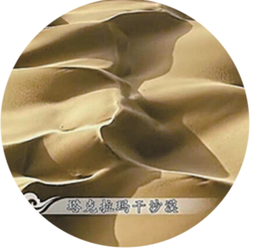
▲沙丘起伏的塔克拉玛干沙漠