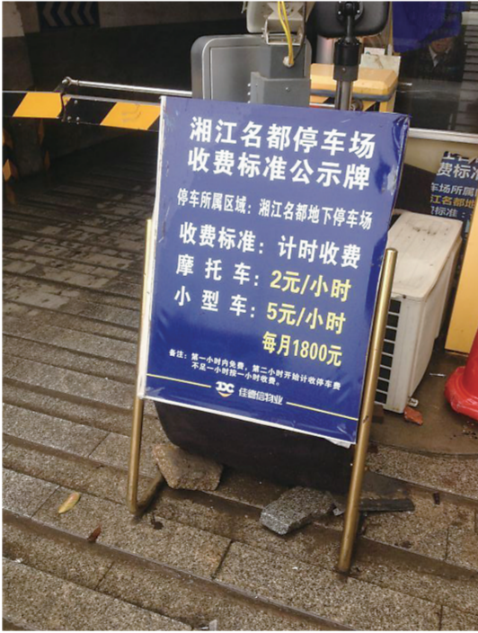
▲2年后,湘江名都地下车库入口处“月租1800元”的“天价”收费价格表仍在

小区停车费矛盾的频繁爆发,大概要从我省2014年4月1日起执行的《湖南省机动车停放服务收费管理办法》说起。 市发改委服务价格管理科科长说,当时全省出台该政策的大背景是相应国家的“减政放权”政策。根据《物权法》“谁投资谁受益”等规定,将住宅小区停车收费划为了市场调节价。市场调价就是指由经营者自主制定,通过市场竞争的方式形成的价格。 在此文件出台之前,住宅小区收费是政府指导价。 蒋科长说,2014年4月1日以前,物价部门在审批住宅小区停车收费的时候基本遵循了一个原则:地下车位不超过300元每车每月,地上车位收费不超过100元每车每月。在实际审批中,全市地下停车场的收费基本都控制在260元每车每个月。 “为什么绝大部分是260元。”蒋科长说,他们审批此价格是有据可依的,当时是参考买个车位以10万元结算,10万元存在银行里,每年的利息为3000元到4000元。这个费用与260元一个月的支出大抵相当。 随着住宅小区停车服务收费变成市场定价后,260元每个月的收费在我市已经成为历史。坊间担忧小区停车价格将疯涨。担忧很快变成了现实。2年来,包括株洲在内的国内不少城市,均出现了开发商“按照市场定价”开出高价停车收费月租的新闻。 国内小区收费定价放开的消息刚一传出,天元区的湘江名都小区就做了第一个吃螃蟹者——小区地下车位停车月租从约400元每月,涨价至1800元每月,车库月租更是涨到了3600元/月。 当时,该小区开发方相关负责人告诉记者,在小区停车收费放开的背景下,小区车位租金由开发商根据建设成本、管理成本等综合制定,如果业主不想租用,完全可以购买车位,购买车位时,开发商将与合作银行一起为业主提供较具吸引力的贷款方案。 上述负责人认为,开发商有收回成本的考虑,业主也可以根据租用及购买车位的成本,综合考虑是租是买。 然而,对此,大多数业主却并不买账。3月13日,记者走访了湘江名都小区,该小区物业方工作人员告诉记者,目前,小区停车收费租金仍为1800元/月,但苦撑2年,至今无一人从开发商处租车位。