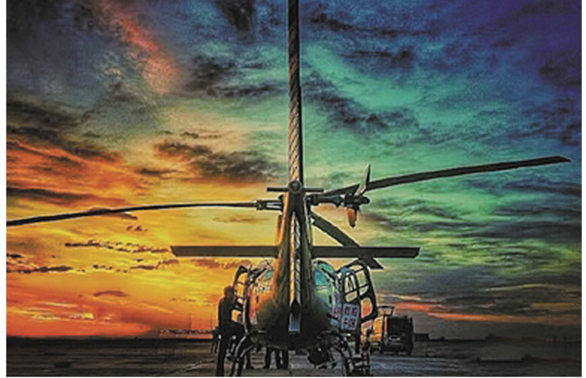
▲节目组用于航拍的直升机

第六集:上海 从空中俯瞰拥有20多栋西式建筑的外滩,以及入夜后灯火璀璨的滨江路、南京路。摄制组还从全新角度拍下了东方明珠、证券交易所、金茂大厦、环球金融中心、上海中心大厦……把这座大家熟悉的的城市拍出了不一样的风韵。