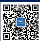
扫码了解更多优惠信息