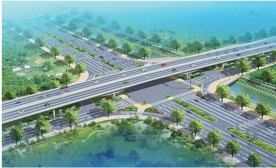
▲北环线与云龙大道将采取如图互通形式(资料图)

本报讯(记者 黄林)3月13日,家住荷塘区戴家岭附近的市民李先生向本报记者反映,北环线已于去年11月12日开工,但戴家岭附近路段为何至今不见动工迹象?记者昨日前往现场进行核实。