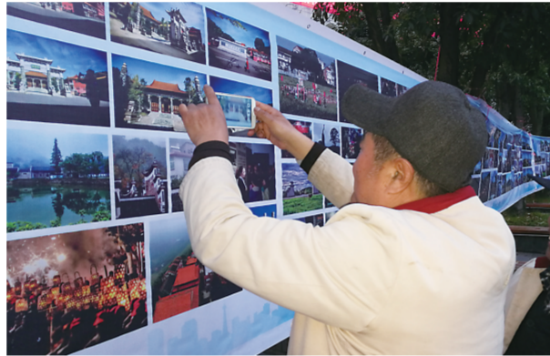
▲市民在观看展览