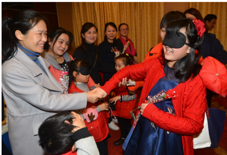
▲昨日,校园记者通过握手猜出自己的妈妈,并送上一束康乃馨

本报讯(记者 何春林)昨日是“三八”妇女节,株洲日报社校园记者俱乐部组织小记者们,通过互动游戏的方式陪妈妈过节。当晚6点,20名来自白鹤小学的小记者,以及他们的家长相聚在天台开元大酒店。在“妈妈的味道”活动环节,酒店工作人员将妈妈们为孩子制作的西红柿炒蛋、香酥草鱼块、鸡蛋肉卷等菜肴一一端上桌。这些菜品用碗统一,碗底有妈妈的名字。小记者们排着队,寻找妈妈制作的那道菜。