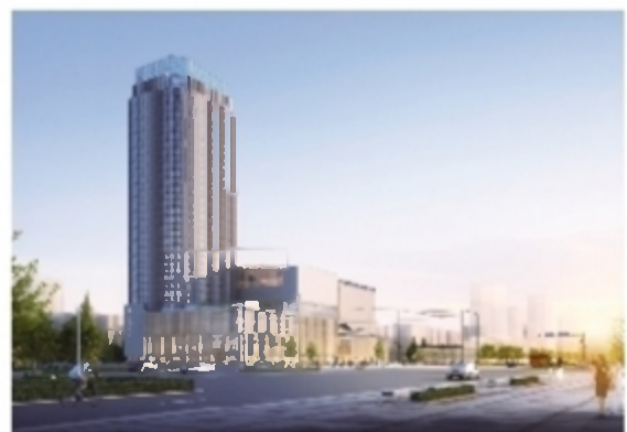
市第二工人文化宫提质改造项目效果图