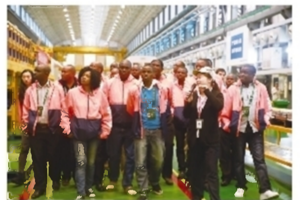
中赞经贸合作区“劳动美”班组长友好交流一行来株交流工会工作

加强对外工作交流,进一步扩大了株洲工会工作的影响。2016年6月1日,香港工联会湖南参观团40余人到株洲考察交流工会工作。10月24日,中赞经贸合作区“劳动美”班组长友好交流一行来株,就如何主动对接和融入“一带一路”战略,工会如何推动构建和谐劳动关系,打造工匠精神展开交流。