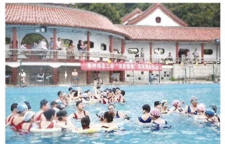
“浪漫七夕·冰爽情缘”冰袖派对现场

致力打造全市单身职工婚恋交友平台,开展“美容情缘”系列活动,解决职工婚恋难题。2016年成功举办了“牵手·920”及“浪漫七夕·冰爽情缘”冰袖派对等数十场交友联谊活动,采取多种形式为单身职工婚恋“牵线搭桥”,正式交往500余对,步入婚姻殿堂48对。