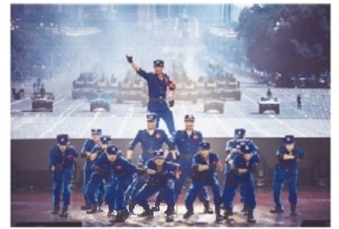
《风笛交响》参加全省“欢乐潇湘”企业专场并获一等奖

成立职工美术、书法、舞蹈、篮球、太极拳健身和乒乓球等6个职工文化工作专业协会,为丰富职工业余文化生活搭建了更加广阔的平台。成功举办职工健步行、职工篮球赛、地税专场文艺演出、新年音乐会等大型文体活动,参加全省“欢乐潇湘”企业专场并获一等奖。开展“送文化、惠职工”系列活动,向一线职工免费赠送演出门票4万张、电影票1.2万张。