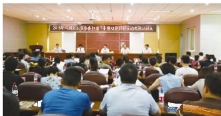
2016年株洲市工资集体协商工作暨构建和谐劳动关系培训班

2016年7月29日,首次组织60位中小企业负责人举办工资集体协商暨构建和谐劳动关系培训班,在全省首创“老板培训”模式。全市已开展集体协商企业5959家,签订区域、行业协议118份,建制率达94.3%。规模以上非公企业厂务公开和职代会建制率达到83%。我会作为全省唯一城市工会代表在全国深化集体协商工作座谈会上作典型发言。