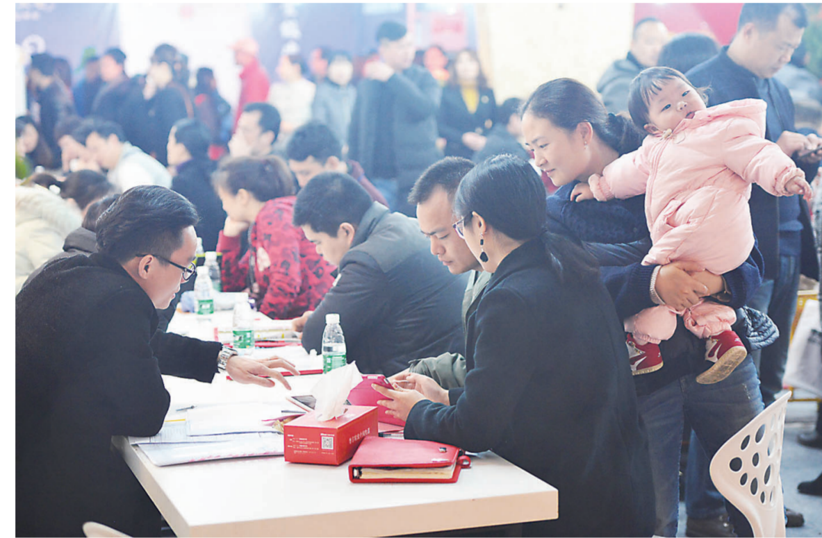
▲家博会现场, 人流如织

昨天上午, 由株州市住房和城乡建设局、株州日报社共同主办, 株州晚报、株州市装饰装修行业协会共同承办的“株州望云五金建材城/体育新城”杯株州市第18届望云第一届家博会在河西体育中心如期拉开帷幕, 吸引了众多市民前往。 据了解, 本届家博会共有12家株州主流家装企业, 近50家一线建材、家居、软装、电器等商家参展, 众多产品一起让利促销, 为消费者送上开年第一波装修优惠, 家博会现场更有全程不间断的抽奖、家电大礼、免费签到礼品等着您来。 另外, 本届家博会期间, 除了一站搞定家装之外, 豪车展也将同步进行。包括奥迪、宝马、奔驰、进口大众、汉腾、北京现代、广汽传祺、江淮、福特、斯柯达、奇瑞、三菱、名爵、上汽大众、广汽丰田、jeep、风行等众多品牌, 其中有不少推出了家博会购车特别优惠政策。 除了参展商家的各类优惠, 只要到现场逛家博会, 就有机会获得全免电影票、餐饮代金券、超萌系多肉植物、陶瓷水杯、半价抢黄金商榷等众多福利。您还在等什么?