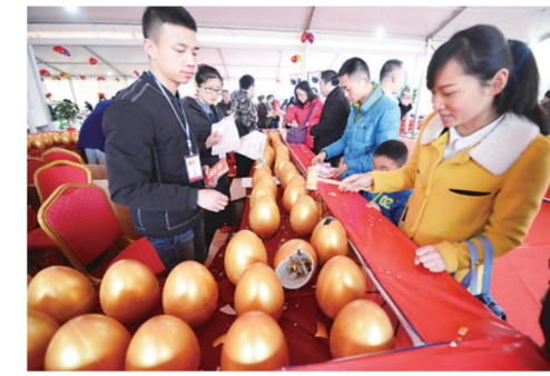
▲消费者现场砸金蛋

昨天下午, 在家博会主舞台举行的现场砍价会, 吸引了众多市民的参与。 “参与砍价的商家有恋家私、梵·戴克地板、兰舍硅藻泥、梦天木门、欧神诺陶瓷、誉丰地板、诺贝尔磁砖、喜临门床垫、金牌厨柜等。”组委会负责人介绍, 为了给市民最大让利, 组委会特意邀请了专业砍价人士, 为消费者把关。 记者在现场看到, 恋家私一套原价4999元的餐桌, 为参加家博会, 特意让利7.5折。但在专业砍价人士的步步紧逼下, 折扣步步降低, 最终被砍到以2888元的价格成家。“已经没有利润可言, 只是为了回馈市民, 打响品牌。”在砍价会主舞台上, 恋家私私株州区域负责人被砍价人员逼得没有退路之后坦言。 “砍价会今天还会继续, 欢迎市民前来一起砍价。”组委会负责人说, 如果市民发现在株州任何家居市场同样的产品比砍价会更低, 组委会将赔偿消费者损失。