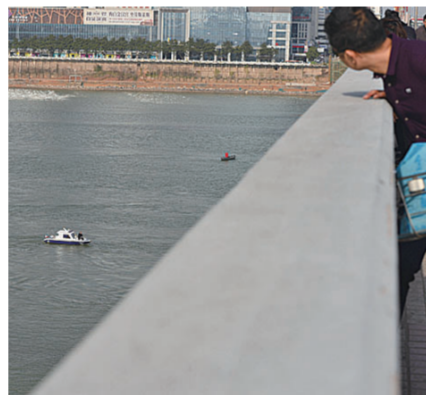
▲3月1日下午,株洲大桥下,公安正在江面上搜救

当天晚上8点,记者从株洲市公安局治安支队八大队了解到,救援工作仍在紧张进行,目前还没找到该女子。