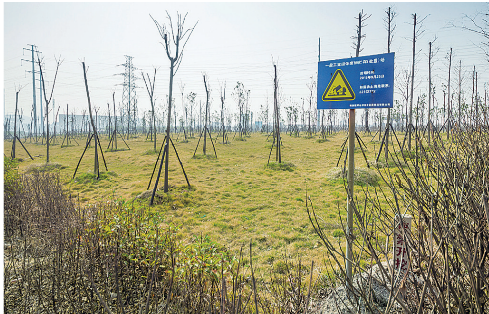
▲清水塘重金属废渣场治理后,一片绿意,生机盎然

另外,我市还计划在完善“十二五”时期遗留废渣调查的基础上,开展第二次历史遗留涉重金属废渣调查,根据废渣位置敏感性和对环境的影响程度,及时开展综合治理。