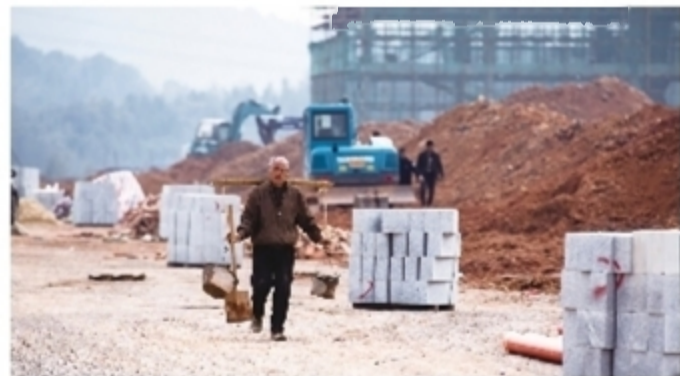
人勤春早,项目工地一片火热

一个更主动的公共卫生服务体系将持续发声。今年,今年荷塘区将重点从四方面发力:建立巡诊工作机制,开展健康教育、强化重点人群管理、探索医养结合模式。针对0-6岁儿童、孕产妇、老年人、慢性病人等重点服务人群,荷塘区将做好精准服务。今年,“慢病患者俱乐部”、“孕妈服务中心”等公益机构都将建立,6岁以下儿童有望实现免费健康体检。