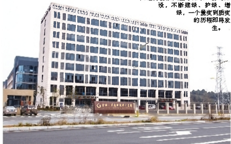
已经投产的国投新材料一期

产业类项目值得期待。 ——做好集聚文章,壮大第三产业。中央商务区、水竹湖科教新区和太阳商贸集聚区即将全新蜕变:在中央商务区,这里将积极培育商贸、文化、餐饮、娱乐等消费性服务业,并加快601钻石商务区、两后岭上月湖片区商住综合体、红旗广场西两片商务综合体建设;在太阳商贸集聚区,这里将着重土地开发高端生态地产项目建设,完成太阳村城中村改造,推动恒大地产等项目快速启动;在水竹湖科教新区,随着基础设施日趋完善,这里以东郊美的城二期、水木阳光里为代表的房地产项目,将重新定义河东人居标准。 ——瞻瞻健康产业,一产三产齐舞。荷塘月色休闲康养区正在迎来曙光:通过加速推进孝文化园、流芳公园园建馆工程建设,大力打造“荷文化”“孝”文化品牌和生态环境品牌,旅游业之花即将全新绽放;以美丽乡村为目标,引导多渠道力量投入生态建设和基础设施建设,不断建绿、护绿、增绿,一个量变到质变的历程即将发生。