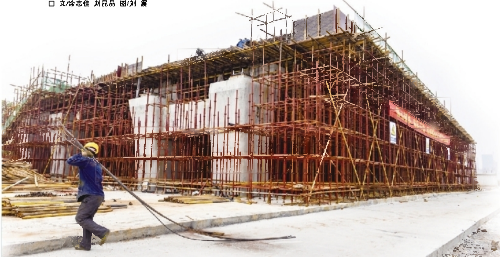
今年,荷塘大道延伸段将迎来全新的实践

春风浩荡,正是万物蓬勃之时。2017年是荷塘区供给侧结构性改革的深化之年,也是贯彻落实市第十二次党代会精神的首战之年。以打造实力荷塘、活力荷塘、宜居荷塘为目标的荷塘区,在早春之际,吹响了项目攻坚的集结号。 该区提出,今年将集中攻坚136个重点项目,这些项目预计总投资463.02亿元,年度计划投资130亿元。按照项目性质分,新建项目83个,续建项目31个,改(扩)建项目3个,前期推进项目19个。 围绕只争朝夕的2017年,更着眼未来五年的发展,荷塘区正以时不我待的魄力,互指新的征程。