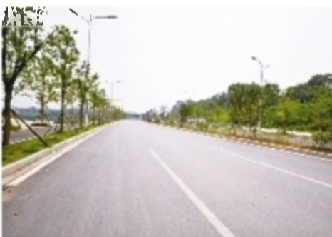
路网建设,更加给力