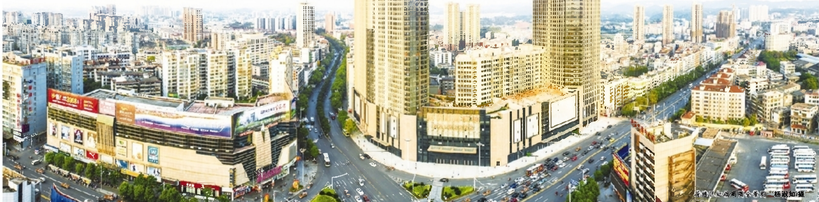
荷塘区红谷南园全景图

——更趋完善的基础配套。2017年,又有9条市区道路建设预计开工,以新塘路、金桥路等为代表的6条主干道将迎来突破,对盘龙大道的步伐将进一步加快,包括上月湖路在内的21条小街小巷将完成提质改造,新建农村公路30公里,进一步优化区内交通。此外,随着旧城提质步伐的进一步加快,今年荷塘区将启动新塘西两片区、日月湖片区、太阳村片区等城中村改造项目,力争完成棚户区改造5100户以上,以推动老城区有机更新。 ——更加宜居的生活环境。今年,荷塘区将大力实施碧水蓝天行动,深入开展湘江保护与治理第二个“三年行动计划”,同时加快株洲鑫达洗涤厂等四家洗水企业停产搬迁及后续工作,推动人民医院等医疗机构废水处理设施升级改造,全力配合做好臭臭水体污染治理。同时,荷塘区还将加快飞鹿高新材料挥发性有机废气处理设施升级改造等项目建设,力争空气质量优良率超过80%。此外,荷塘区还将持续抓好生态绿心保护工作,加大仙霞岭省级风景名胜、黎山岭省级森林公园资源保护力度,逐步提高森林覆盖率。