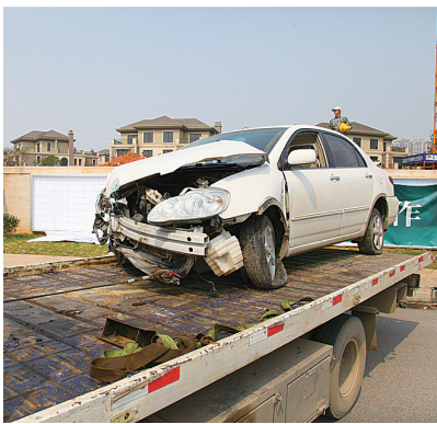
▲事故车被撞得面目全非

本报讯(记者 姚时美)昨日中午,天元区湘水湾小区高尔夫球场入口处发生一起交通事故,一辆小车冲出道路撞上路边的广告牌。据了解,小车驾驶员受伤,可能是车速过快突然爆胎导致事故发生。