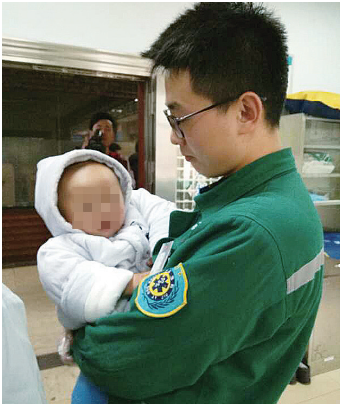
▲省直中医院医护人员带着小孩做检查

本报讯(记者 何春林 通讯员 李菁菁)昨天早上6点左右,神农公园附近的草坪上发现一名男婴,大概只有10个月大小,其父母不知去向。