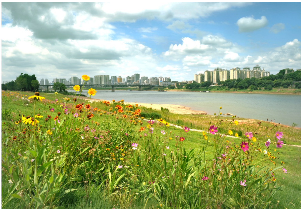
海绵城市建设中的湘江风光带综合治理项目。(资料图)

城市更新是城镇化发展的必然过程。2024年，株洲城中村改造大动作频频。株洲市房票服务中心揭牌，有力助推全市13个城