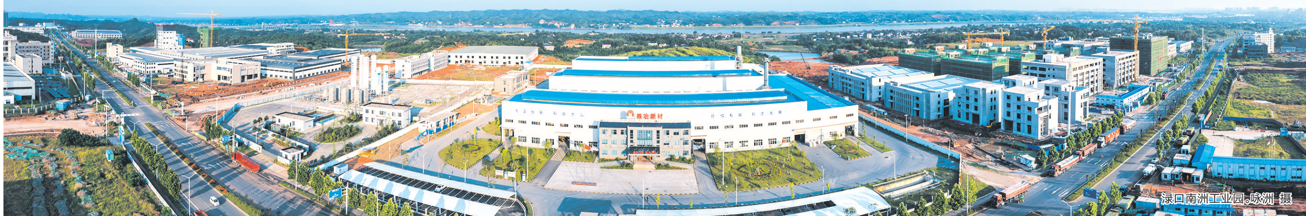
渌口南洲工业园,株洲·摄

同时,做好“以赛兴城”“以节促旅”文章,把端午龙舟赛打造成为渌口赛事品牌,继续申办2025全国体育传统学校篮球联赛,切实把人口流量转化为消费增量。