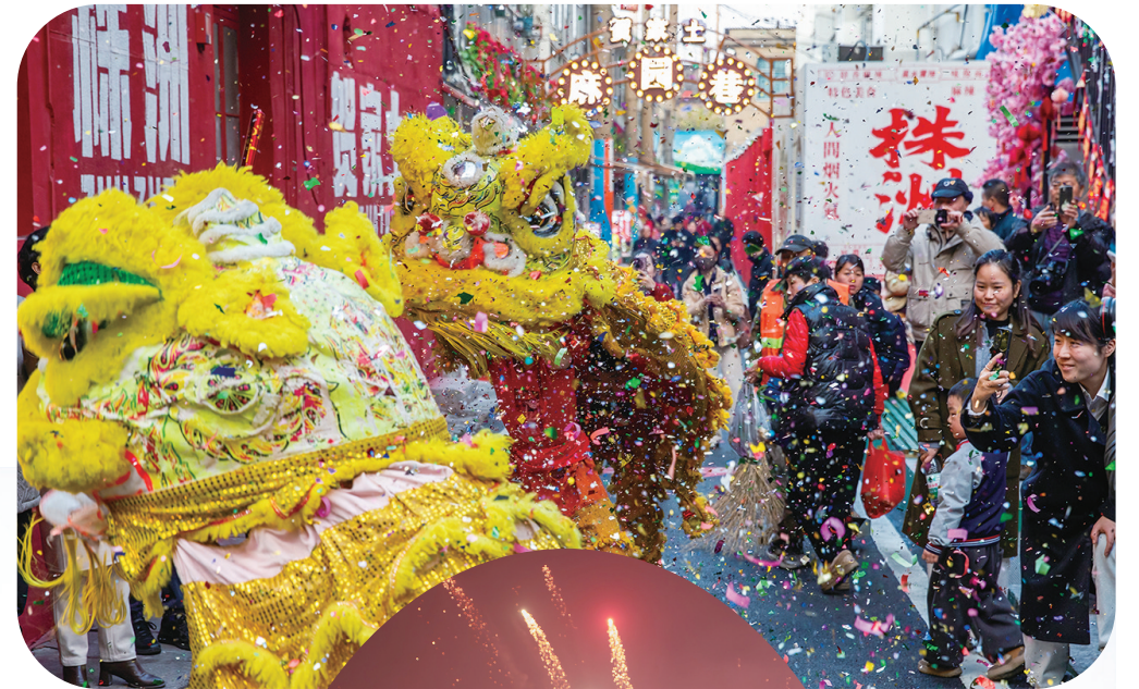
麻园巷热闹的开卷活动。陈向东 摄