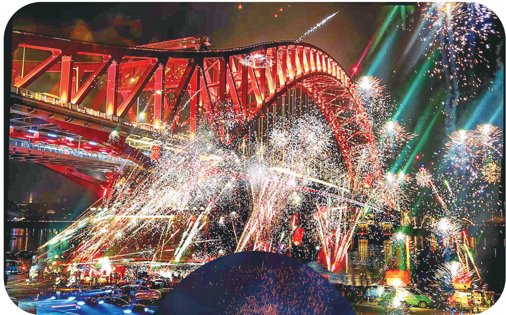
八桥夜市的新春嘉年华。

这个夜晚,新城一个又一个精心准备的跨年仪式满地铺开,无论你选择哪种方式跨年,都请记得,这是一个关于爱与希望的日子。愿新的一年,时光温柔,所想皆如愿,所爱皆平安!