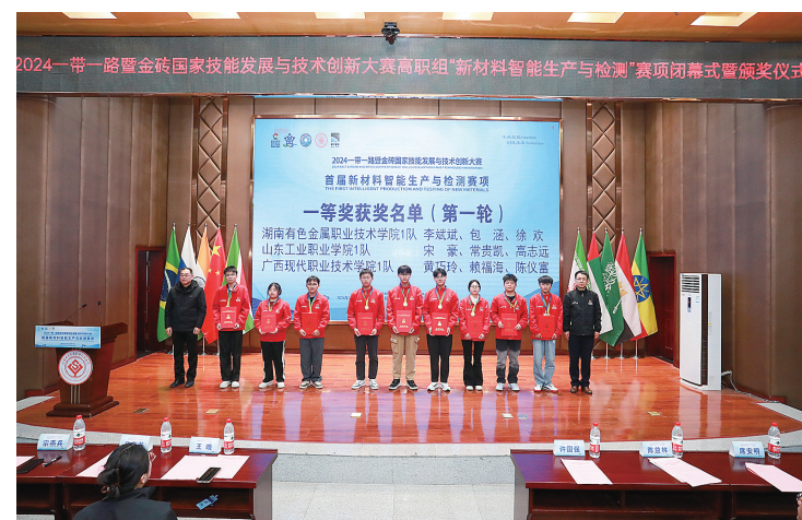
一等奖(部分)获奖选手合影。

株洲日报讯(全媒体记者/孙晓静 通讯员/文媛) 近日,2024年第一届全国新材料智能生产与检测大赛首届新材料智能生产与检测赛项国内总决赛,在湖南有色金属职业技术学院落幕。来自18个省市57支参赛队共计170余名选手同场竞技,探索新材料高科技人才的成长之路。