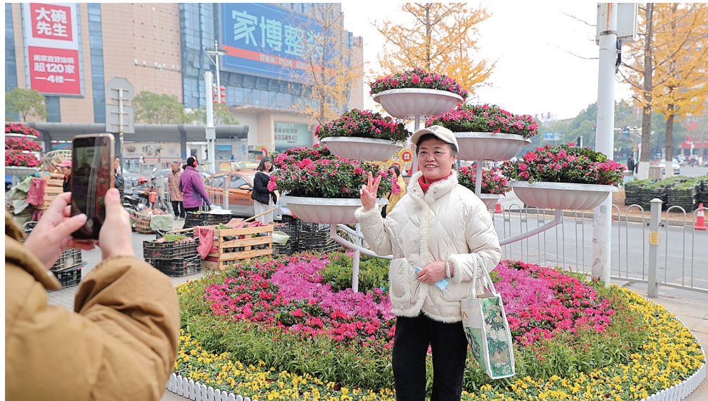
市民正在红旗广场新布置的景观前拍照留念

株洲日报讯(全媒体记者/向胤蓉 通讯员/周云 贺冬莲)寒冬岁末,辞旧迎新。在2025年元旦到来之际,荷塘区园林绿化中心本着“降本节支、全员上阵”的原则,组织全体干部职工全力以赴赴重点路段、人流密集场所进行节日氛围景观营造工作。