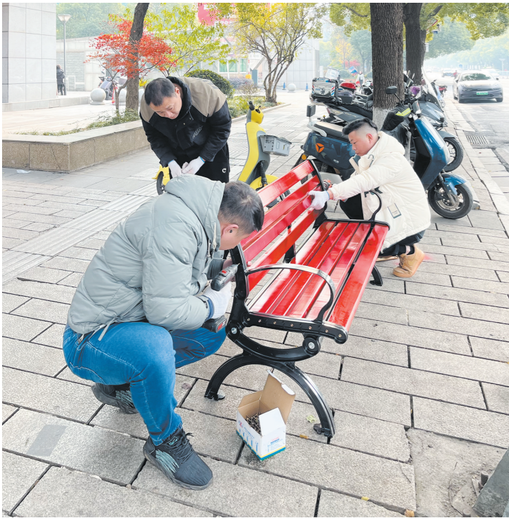
12月19日,天元区黄河南路,人行道上增加了几张新休闲座椅。天元区市政维护中心工作人员介绍,此次将在黄河南路、黄河北路、庐山路、神农大道、珠江北路、长江北路等城道路路边更换、增补休闲座椅55张,为市民休憩提供便利。