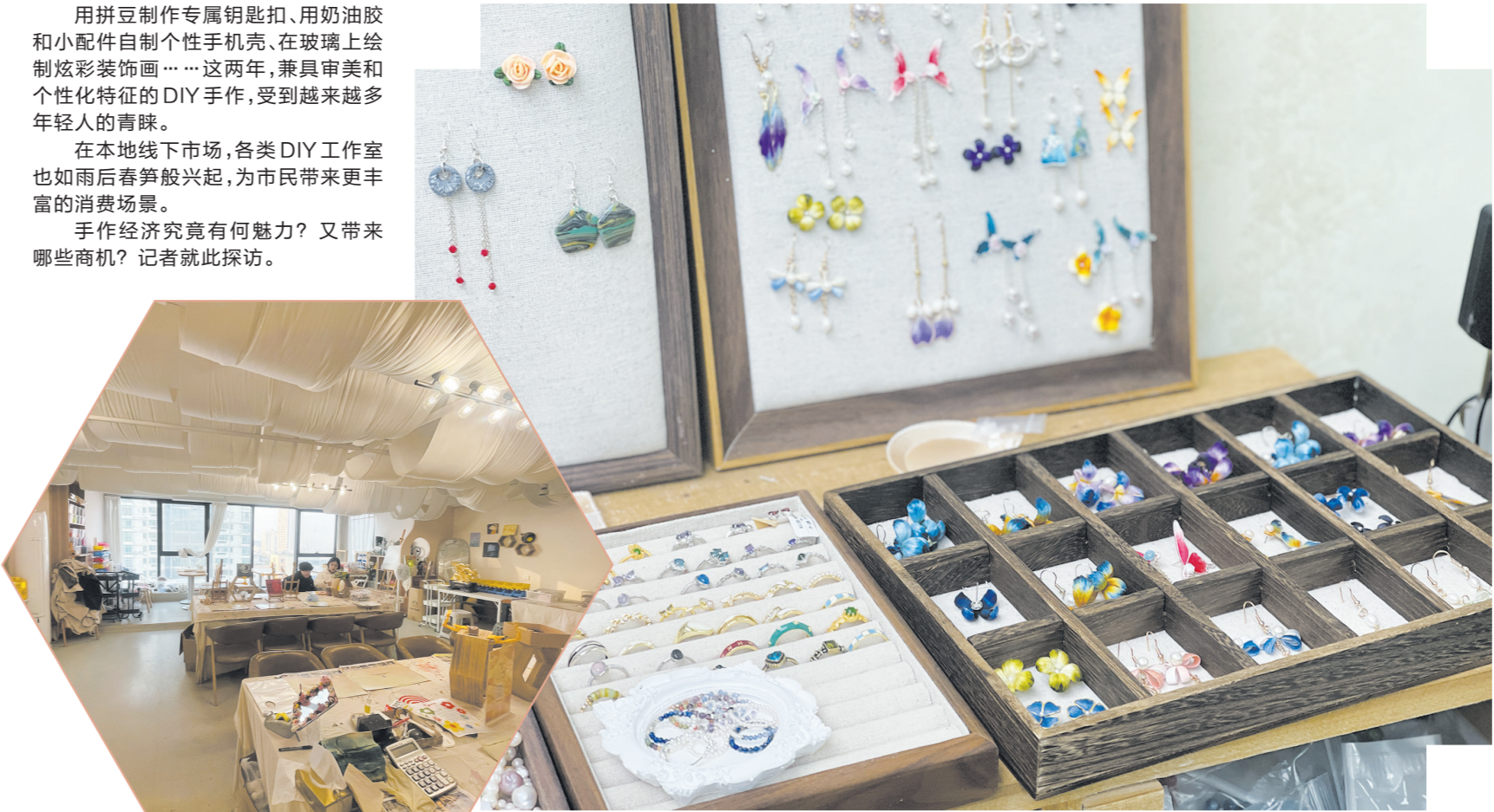
本地各类DIY工作室兴起。