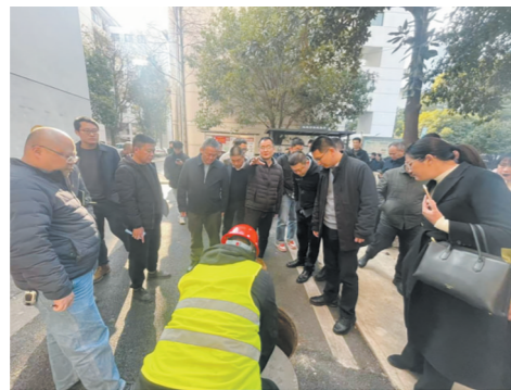
雨污分流改造标杆项目观摩现场。

本报讯(株洲晚报融媒体记者/李军 通讯员/龚子路) 我市城区雨污分流改造如火如荼,已进入冲刺阶段。12月18日,市住建局组织开展雨污分流改造标杆项目观摩,发挥示范引领作用,确保质效并举完成相关目标任务。 雨污分流改造是我市一项重要的基础设施工程,能有效避免污水直排河道造成的污染,提高雨水资源利用效率,助力构建城市绿色水循环。目前,改造项目在各区同步开展,施工现场一片繁忙。 活动中,观摩人员来到雨污分流改造相关标杆项目现场。大家学习先进经验,检视自身不足,纷纷表示要将吸收到的好经验,运用到接下来的项目攻坚中。 市住建局相关负责人表示,雨污分流改造工程必须严格遵循安全施工规范,减少对周边居民生活和交通的影响;施工进度要咬