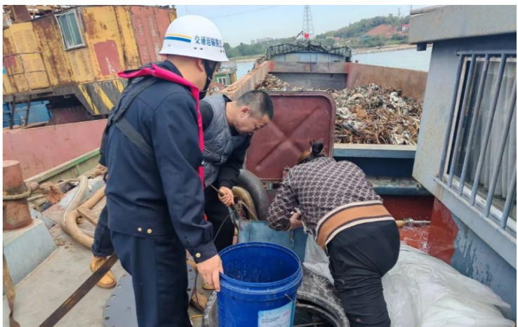
执法人员对遇险船舶展开救援。

株洲市水上交通执法部门提醒过往船舶,一定要严格按照航道部门公布的航道维护水深,合理配载,留足富余水深,千万不要抱有侥幸心理,一旦船舶搁浅,当事船舶除了蒙受经济损失,还将面临行政处罚。