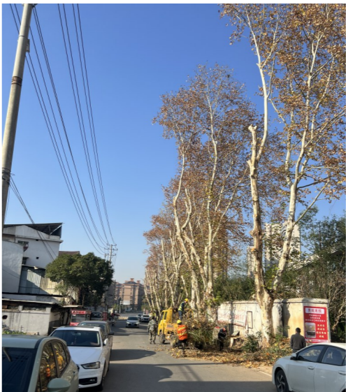
多部门清除校园外枯树隐患。

社区第一时间联系区城管、园林、交警等部门,制定危树处置方案,在确保安全的情况下对枯树进行分断切割、移运,并对周边树木树枝进行修剪,防患于未然。