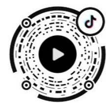
打开抖音扫码观看视频

12月11日,经过43天闭店调改,步步高超市天元店升级开业,作为“胖东来”调改的株洲首店,开业现场非常火爆。