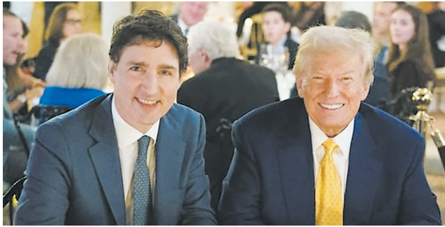
特朗普、特鲁多是“州长”。