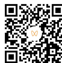
文字、图片、视频/知株侠