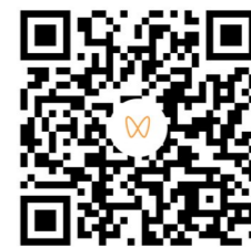
文字、图片、视频/知株侠

12月4日,我市房屋保险试点项目首单落地,市住建局与中华保险、小区业主代表等各方,正式签订物业专项维修资金增值收益购买房屋主体倒塌、外墙系统维修保险协议。