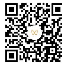
文字、图片、视频/知株侠 发证现场。