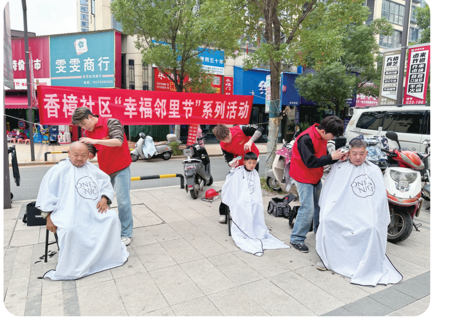
幸福邻里节，志愿者为居民义务理发。

石峰区学林街道文荟社区打牛塘安置小区与长郡云龙实验学校之间的007乡道，有一段100余米长的道路，由于路上坑洼较大，晴天尘土飞扬，雨天泥泞不堪，导致小区300余户居民出行不便。 近日，接到居民“哨声”后，学林街道和文荟社区协调各方资源，并争取上级和后盾单位的支持，对该段道路进行硬化，居民告别“晴天一身灰，雨天一身泥”的困扰，出行无忧。 近年来，学林街道以问题为导向，突出党建引领，全面开展“哨哨行动”，实行“居民吹哨、党员前哨、多方应哨”工作机制，将各类资源力量整合到社区一线，并充分发挥居民的主体性和积极性，围绕“志愿服务、小区治理、群防群治”三大板块，把需求的“哨子”交给群众，将解决的“担子”分给大家，实现吹好哨、报好到、办好事，打造具有学林特色的基层治理新模式。