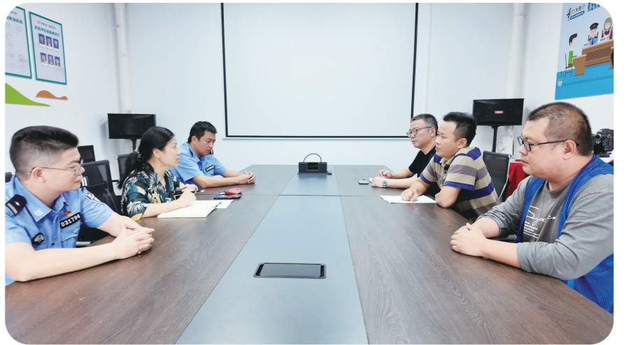
“林里小助”矛盾调解队调解矛盾。

11月7日，香樟社区联合云龙交警大队，在湖南汽车工程职业大学开展“摩电两车、行人交通安全宣讲”志愿服务活动。 活动现场，交警采用真实案例，让学生更直观意识到交通安全的重要性，并以有奖问答的形式，巩固交通安全应知应会知识。“青春学林”志愿者还向学生们发放禁毒、防诈骗的宣传资料，提升他们的禁毒和防诈意识。 近年来，学林街道充分联动职教城高职院校人才、阵地、社区学院等资源，整合成立“青春学林”志愿服务队，将志愿服务触角由“一院校一社区”向“一院校一小区”转变，针对辖区小区一老一少需求，成立“花儿与少年”和“医疗保健”志愿服务队，为居民提供个性化、常态化的服务。今年暑假，香樟社区联合株洲师专和湖南铁路科技职院，在金茂悦小区和学府港湾小区开展儿童舞蹈教学和暑期“薪火·能量吧”成长营活动，为上班族父母减轻了带小孩的后顾之忧。 社区工作人员还联合湖南中医药高专，在学府华庭小区开展医疗保健志愿服务活动，让老年人在家门口也能享受医疗保健服务。 截至目前，“青春学林”志愿服务队累计开展志愿服务活动39场，服务居民超6000人次。