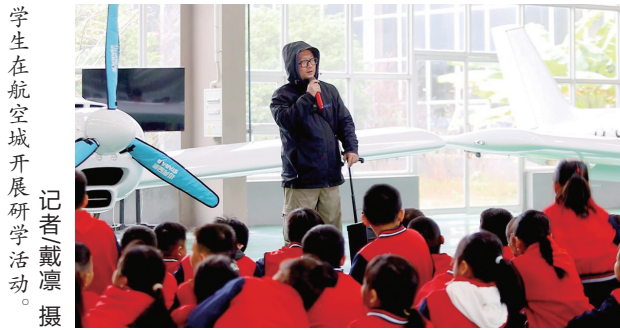
学生在航空城开展研学活动。