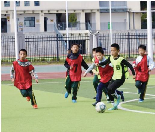
足球健儿在赛场上奋勇拼搏。

此次校园足球赛,有力地推动了学校阳光体育活动的开展,点燃了学生对足球运动的热爱,增强了集体的凝聚力和团队意识,让学生收获快乐,全面健康地成长。