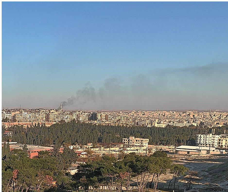
当地时间12月1日，叙利亚北部城市阿勒颇升起滚滚浓烟(手机照片)。

按照《基辅邮报》说法，乌克兰对叙利亚局势的参与若得到证实，可被视为俄乌冲突的外溢，是乌克兰在海外针对俄罗斯目标发起的行动之一。报道称，“希米克”特战小组今年9月中旬成功袭击阿勒颇市东南郊一座俄罗斯驻军无人机基地。