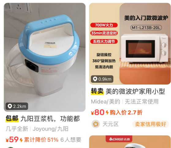
二手平台上转让的小家电。