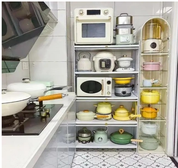
网友晒出家里购买的各种小家电。