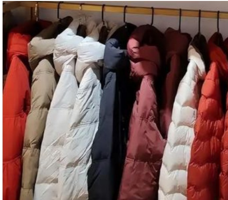
市场上销售的羽绒服,大家可要睁大眼睛好好选购。资料图

寒冬已至,羽绒服、羽绒被等羽绒制品成为市场上的香饽饽,但一部分“假羽绒制品”却在线上、线下市场肆意泛滥。部分直播间里,出现了一些号称价格亲民且品质优良的羽绒被。记者调查发现,一款填充物为“飞丝”的所谓“羽绒服”成本价不到40元,两个月内销售量高达6万多件。