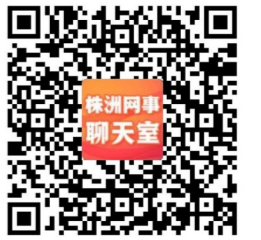
▲扫描二维码加入聊天室

翻了无数遍《生活大爆炸》,每次我遇到过不去的坎都会想到剧中的人或者情节。从宇宙开始就存在的微粒,穿越一百四十亿年的时空才出现的我们,一定会在这些平凡里创造出自己的星辰大海。