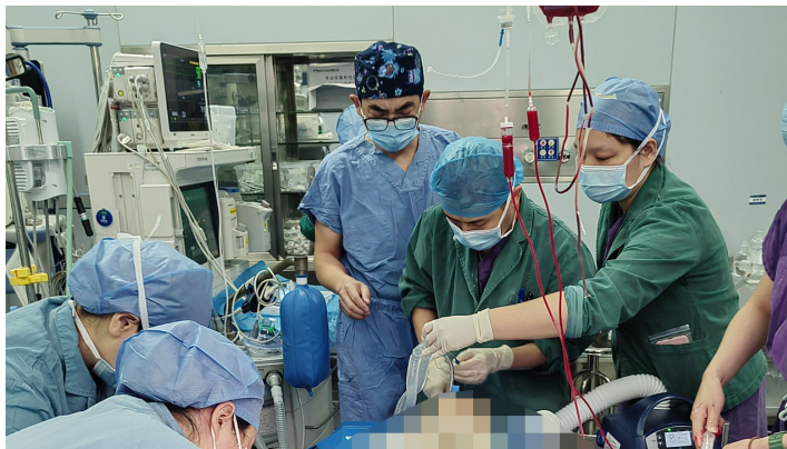
多学科团队正在紧张抢救中。

近日，一女子遭遇交通事故，造成全身多处损伤、肝破裂多发肋骨骨折气胸以及失血性休克，生命垂危。事故发生后，患者被120送至附近医疗机构，鉴于病情危急复杂，接诊医院立即将其转送至市人民医院。