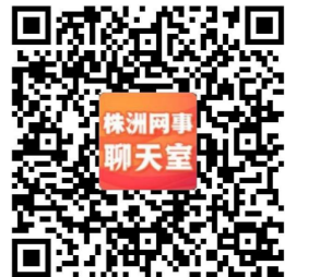
扫描二维码加入聊天室

本想把这个老土但快乐的「去班味大法」安利给常常伏案对着电脑工作的朋友们,后来想了想,又觉得可以安利给所有人。别再信什么写诗就是自恋、写日记就是矫情的鬼话啦,保护感受力、保持对生活的情感和对生命的好奇是天赋的事,永远值得赞美。