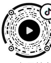
打开抖音扫码观看视频

为重温往昔峥嵘岁月、激励当下更好前行,株洲日报社在全市范围内征集反映天元区经济发展、城市建设、群众生活等方面的老照片,赓续珍贵回忆。本期特别推出“1992年的株洲大桥收费站”。