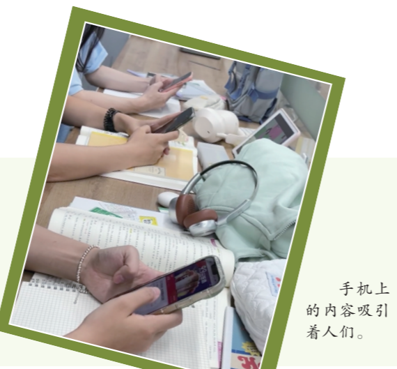
手机上的内容吸引着人们。

“我定期安排时间断开所有数字设备,与家人共度时光,参与爱好,或只是专注于当下。”一位市民表示,一次咖啡约会比十几次网络互动更充实,他希望在享受数字社交的便利的同时,也能保持与现实世界的联系。