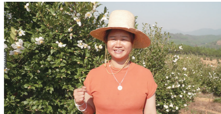
盛开的油茶花让农户感到欣喜。