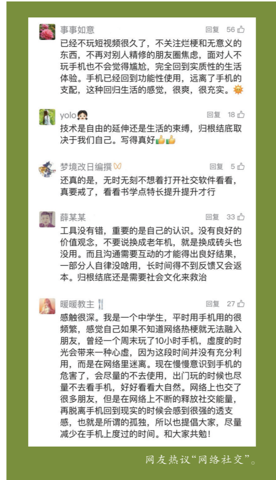
网友热议“网络社交”。