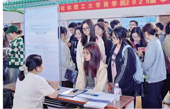
“智汇潇湘·才聚株洲”桂林站,大学生现场求职。

本报讯(株洲晚报融媒体记者/何春林 通讯员/肖思飞)2029份求职简历、6家企业与桂林高校签订长期合作协议……这是我市2024年“智汇潇湘·才聚株洲”赴桂林招才引智活动的成绩单。