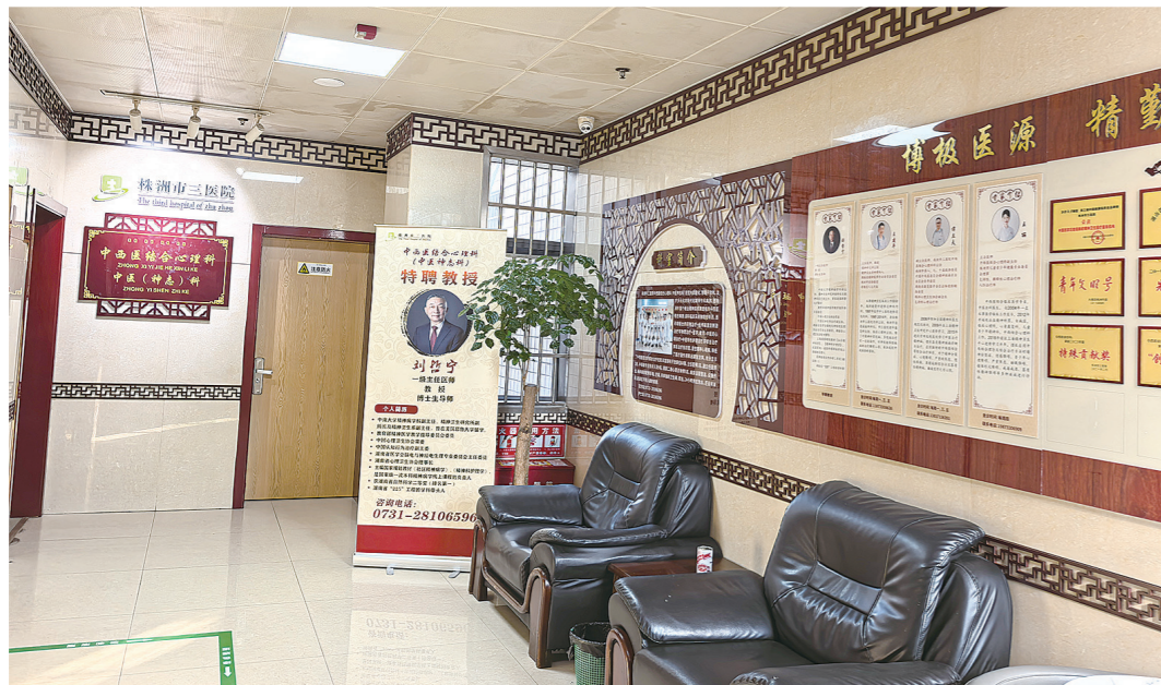
窗明几净的中西医结合心理科病区