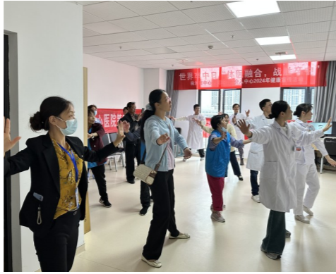
宣传活动现场,医务人员教市民打太极拳。