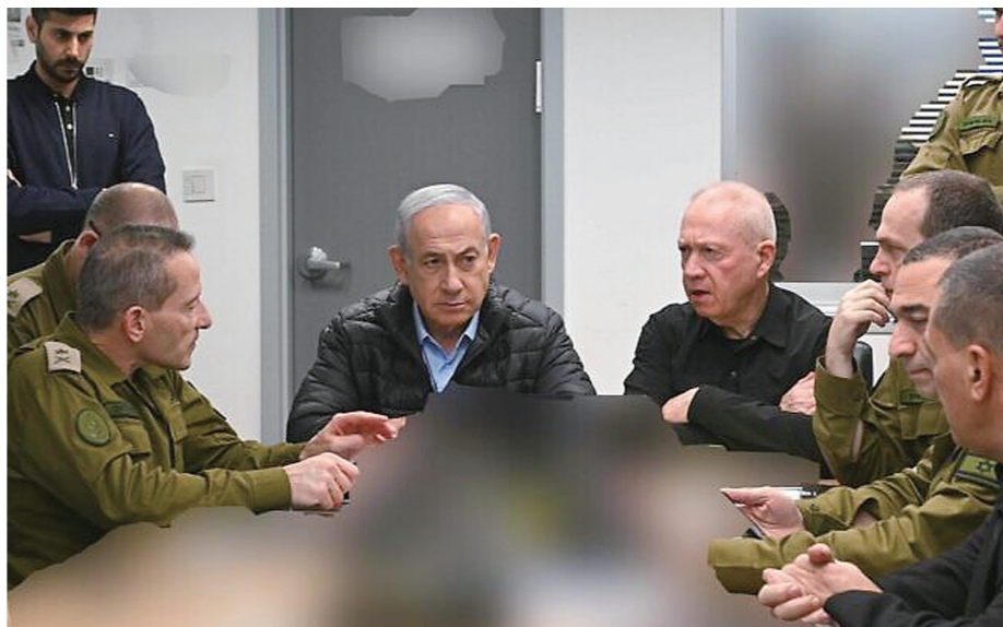
这张10月26日发布的照片显示，在对伊朗袭击期间，以色列总理内塔尼亚胡(中左)、国防部长加兰特(中右)以及国防军高级指挥官坐在位于特拉维夫的国防军总部内。