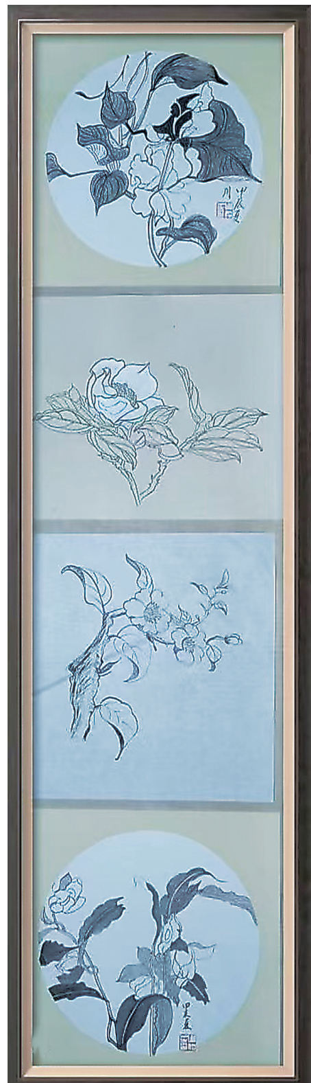
线描《花卉四幅》（周仲芝）