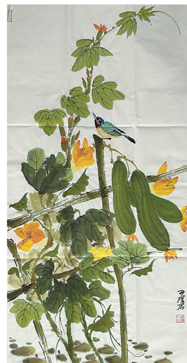
写意画《瓜福绵长》（田琼）