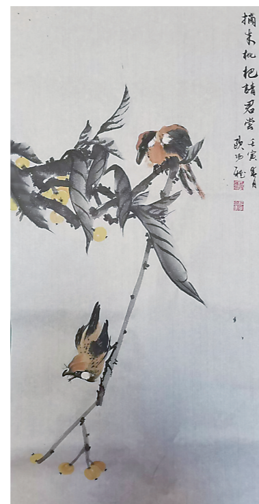
花鸟画《摘来枇杷清君尝》（欧阳雅）