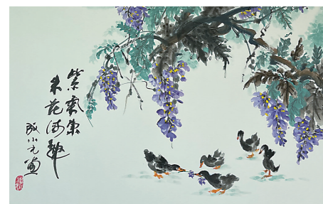
写意画《紫气东来花海趣》（成小元）