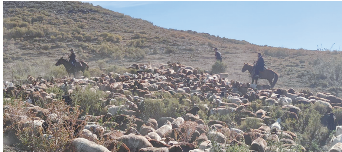
随着天气逐渐转冷，牧民们又开启了一年一度的秋季转场之路。