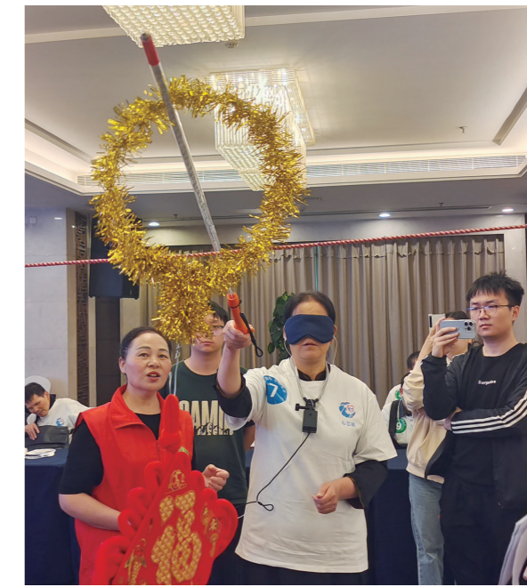
一名盲人佩戴着科技产品，完成了“采摘福挂”游戏。

当天下午，市残联邀请盲人朋友走进我市首家“光明影院”，“观看”盲人无障碍电影。盲人无障碍电影是