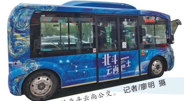
穿梭在职教城的北斗云尚公交。

市残联相关负责人介绍，对盲人朋友来说，日常出行并不容易，如何畅通无阻安全出行，成为盲人朋友共同的心愿。今年以来，市残联在“创新成果转化年”活动引领下，将科技赋能消除障碍列为重点工作内容，不断提升了残疾人的获得感、幸福感、安全感。