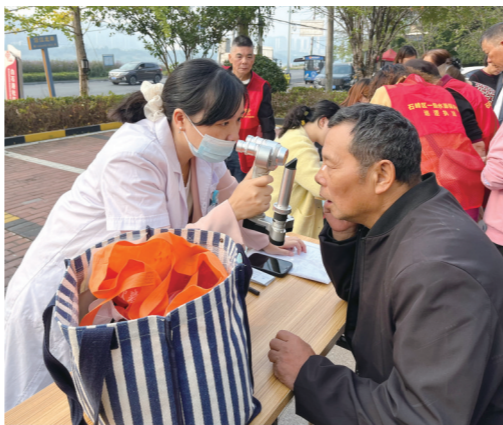
义诊活动现场,老年人在参加筛查。还有150个救助名额,需治疗白内障的困难家庭眼病患者,可拨打咨询电话28290039、28290079,申请救助。