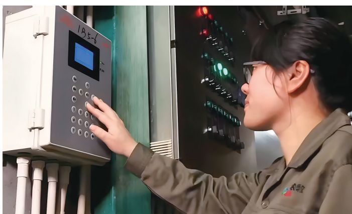
数字农场里,工人在作业。

节目介绍了茶陵等地数字农场,通过集约化生产、数字化管理,用工业化思维做现代农业。