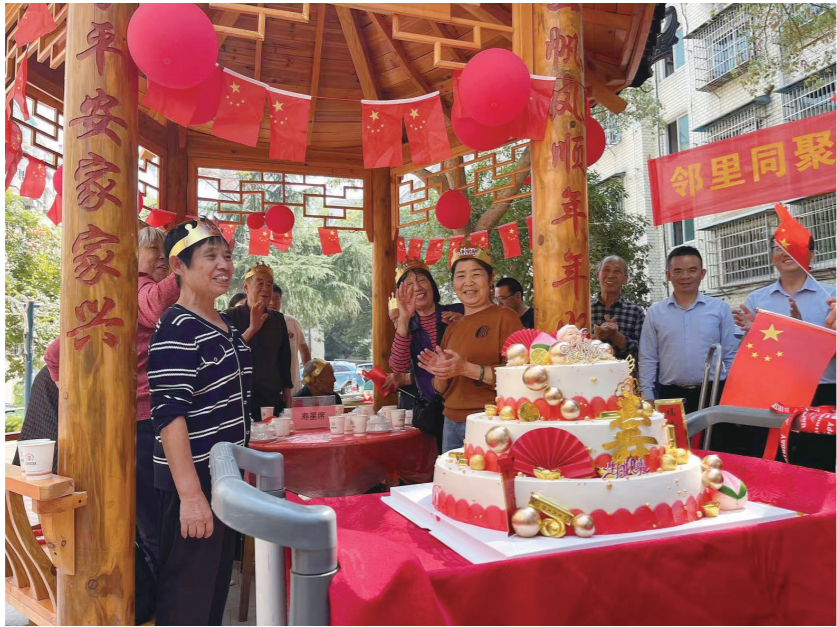
十月生日的老年居民一同庆生。

于是,家园社区党委、小区党支部、业委会、物业等积极响应,并高效完成策划组织工作。工作队队长刘振