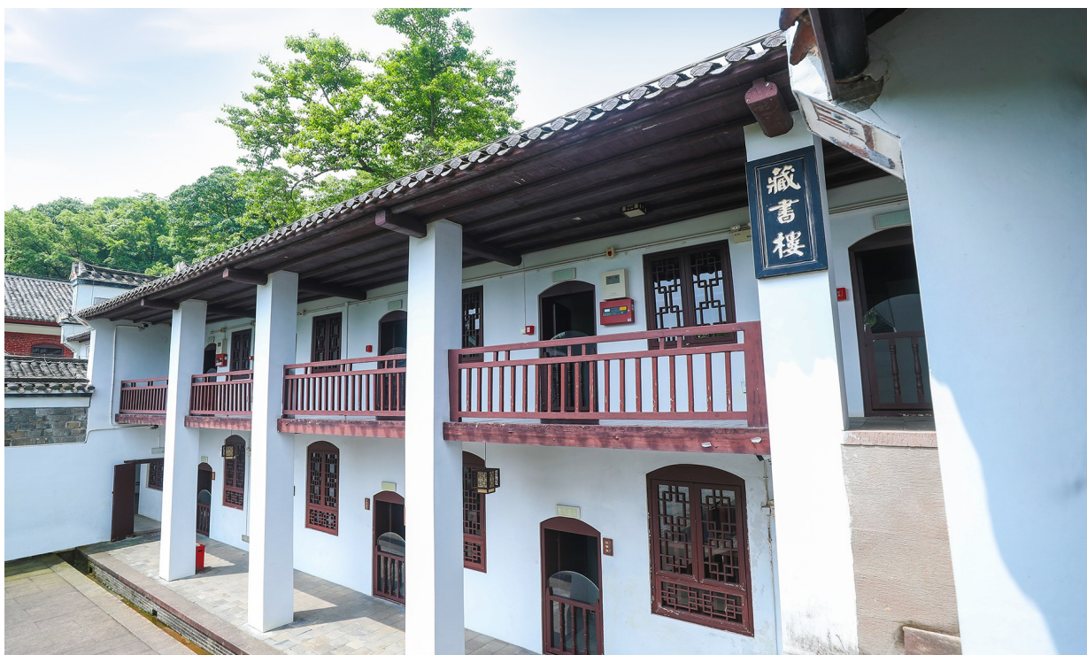
一缕书香,千年不绝——书院藏书楼