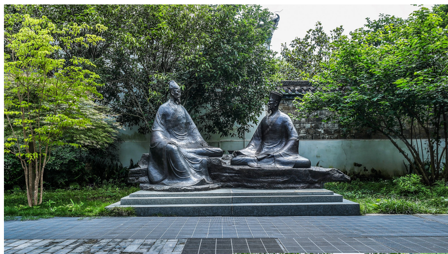
朱张会讲,论道经邦——朱熹与张栻