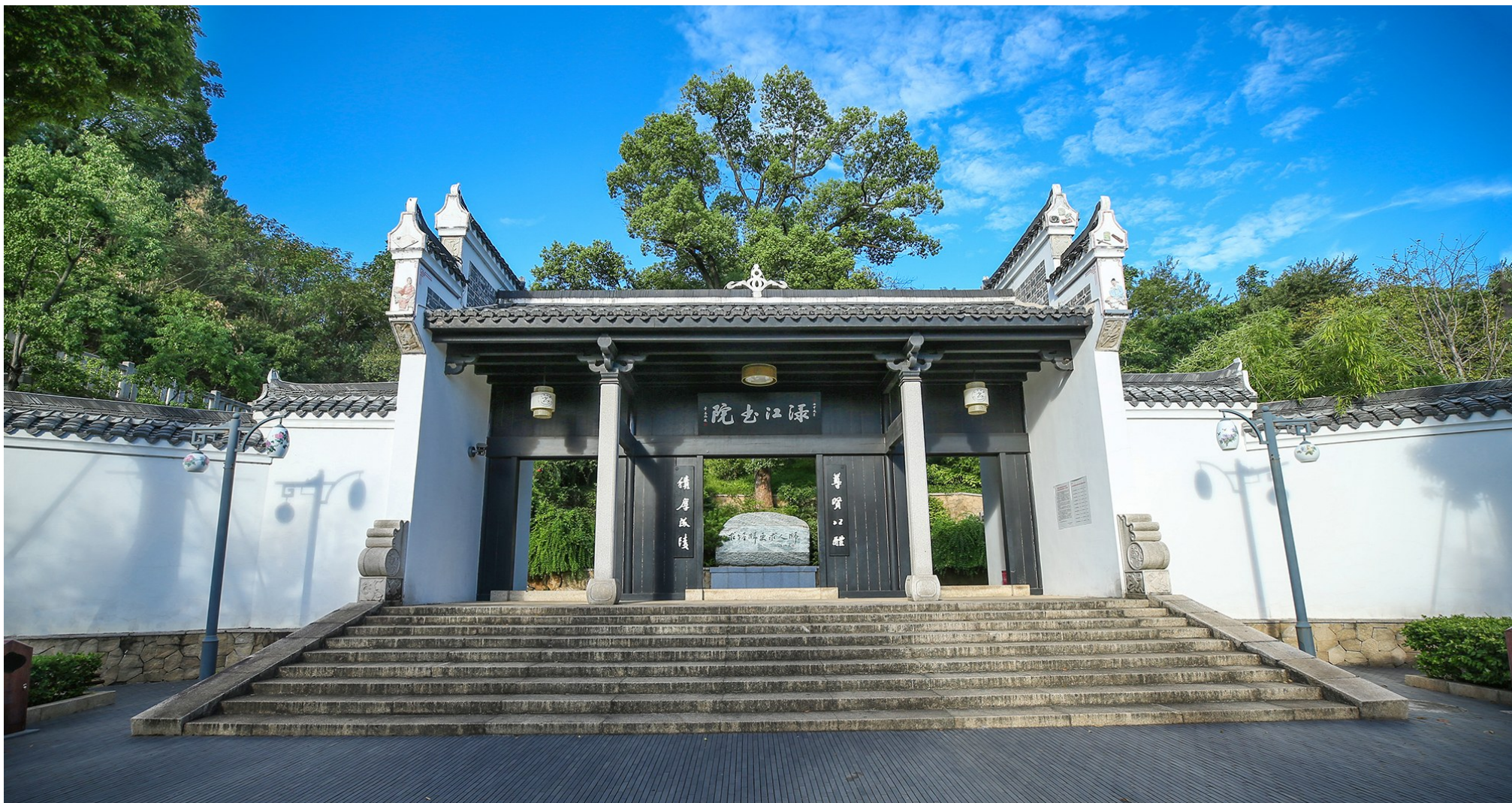
尊贤以醴,积厚成陵——醴陵渌江书院山门

始建于宋淳熙二年(1175),乾隆十八年(1753)倡建于城东门,道光九年(1829)迁建于西山。书院恩承北阙,道接东莱,秀毓西山,是醴陵的文化象征、精神家园和人才摇篮。理学宗师朱熹两度登临渌江书院,晚清名臣左宗棠执掌渌江书院山长3年。李立三、左权、蔡升熙、宋时轮、陈明仁,早年都曾求学于此。现为全国重点文物保护单位。