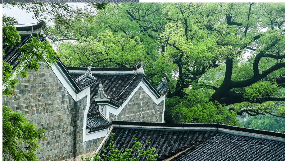
古木参天疏影腾芳——幽静的书院