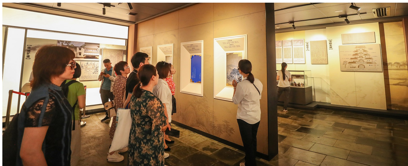
薪火相传,弦歌不辍——川流不息的游客