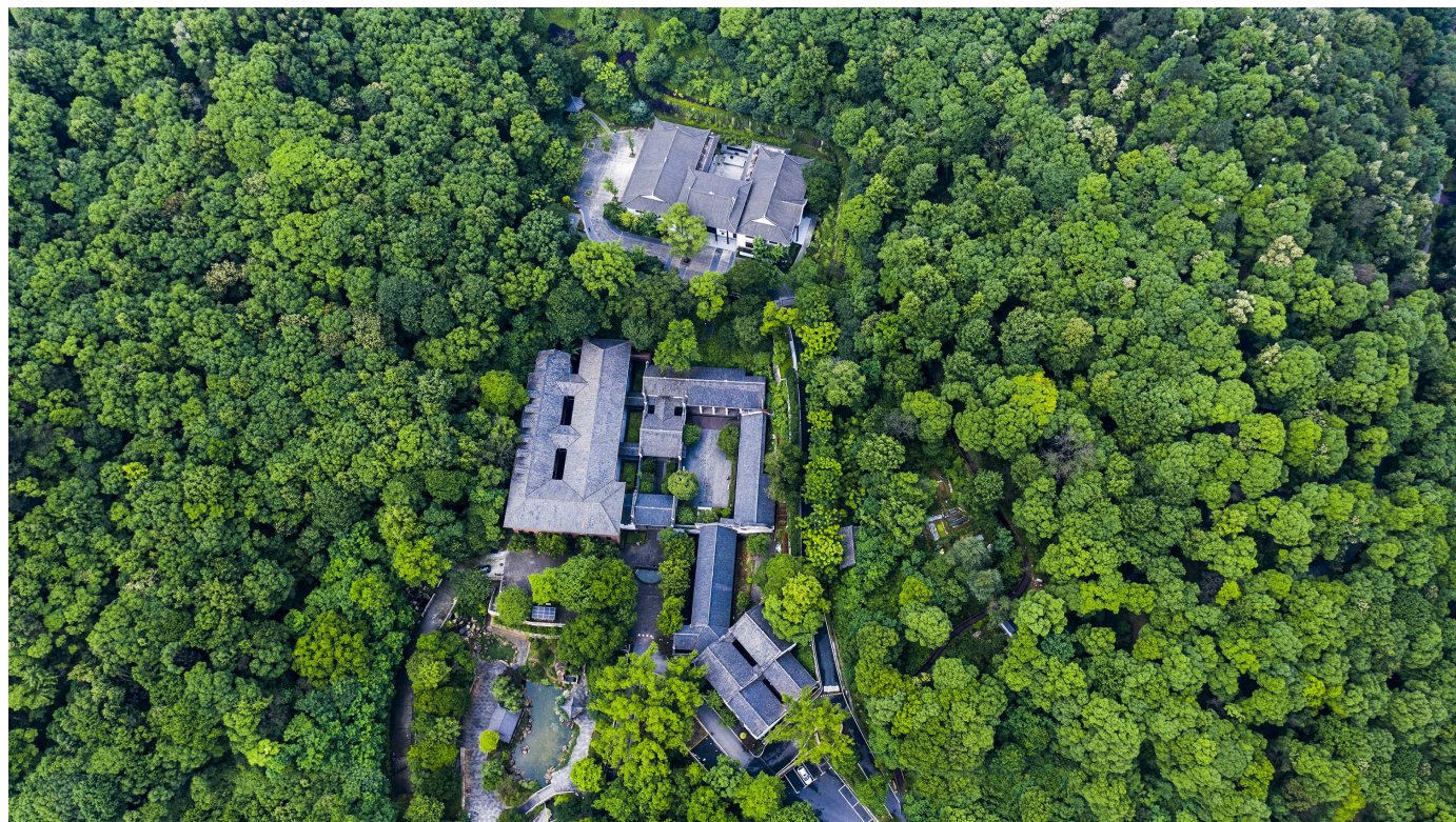
道崇东鲁,秀毓西山——航拍渌江书院