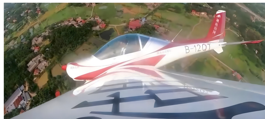
轻型运动飞机“阿若拉”