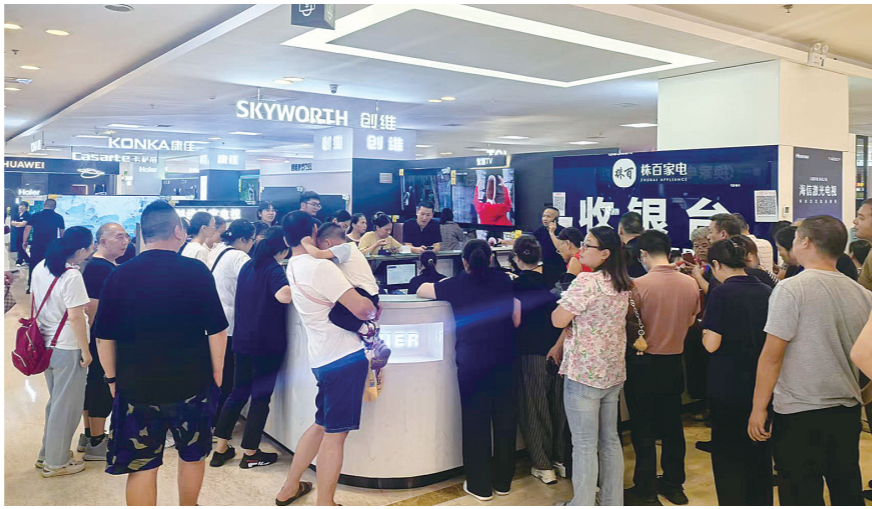
株百家电收银台前排起小长队。通讯员供图