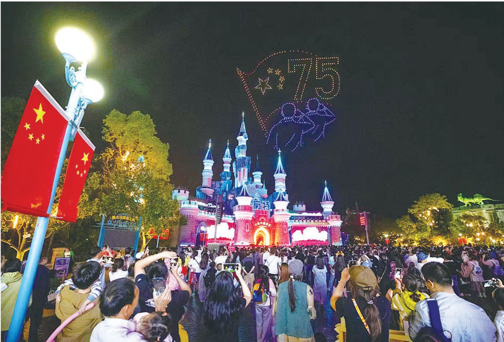
株洲方特旅游区人潮涌动,游客观看无人机表演。