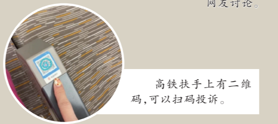
高铁扶手上二维码,可以扫码投诉。