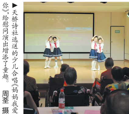
天桥诗社选送的少儿合唱《妈妈我爱你》给慰问演出增添了童趣。