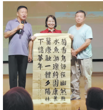
送书法作品给清水塘医院。