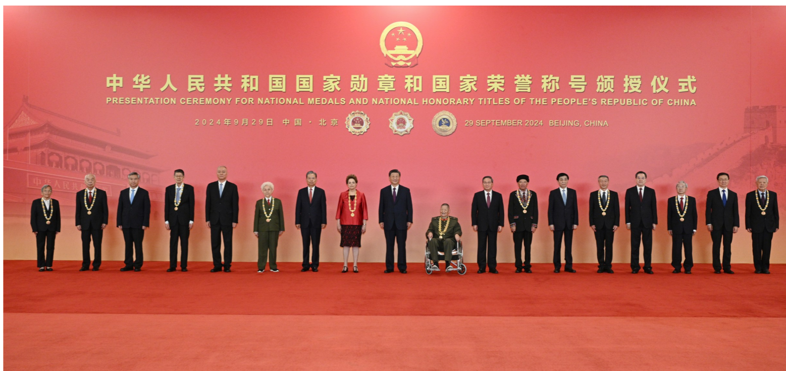
▲ 9月29日,中华人民共和国国家勋章和国家荣誉称号颁授仪式在北京人民大会堂金色大厅隆重举行。习近平等党和国家领导人同国家勋章和国家荣誉称号获得者合影留念。