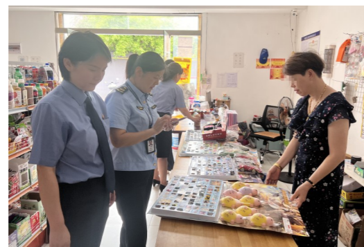
工作人员走访调查校园周边小卖部。

经走访调查发现,仅1家商店未销售盲盒类产品,所有商家均未张贴禁止向8岁以下儿童售卖盲盒的警示标语,大部分商家销售的盲盒标识不完整或生产厂家无法追溯;存在某一商店向学生出售烟卡,甚至销售现金博彩类盲盒产品等情形。