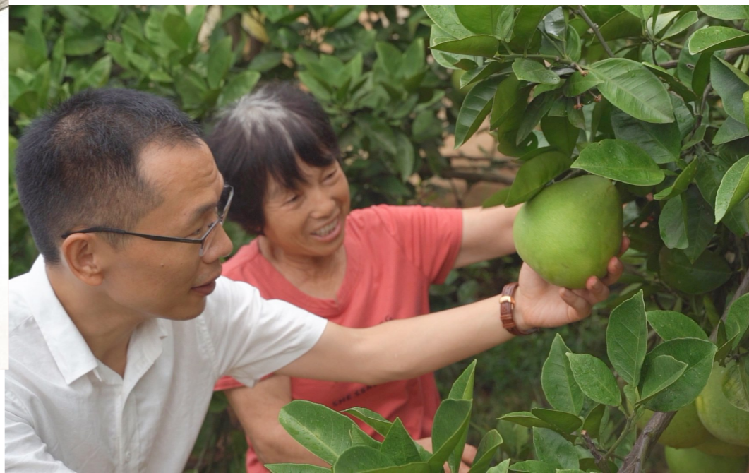
九郎福柚即将上市。

用“微经济”激活乡村振兴“一池春水”。乡村的“院景”更靓,“钱景”更好。在株洲,一个个“美丽农家院落”,似雨后春笋成为助民增收的样本!