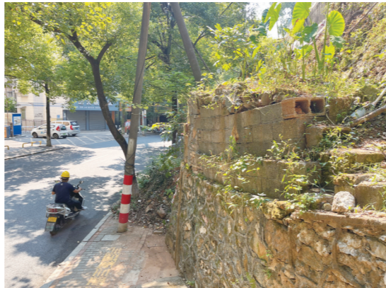
护坡坍塌处,旁边的挡墙上种有蔬菜。

本报讯(株洲晚报融媒体中心记者/刘平) 9月25日,芦淞区株董路“白果山庄”公交车站路段,路边一处垮塌的护坡仍未修复,人行道被泥土掩埋,给行人通行带来不便。