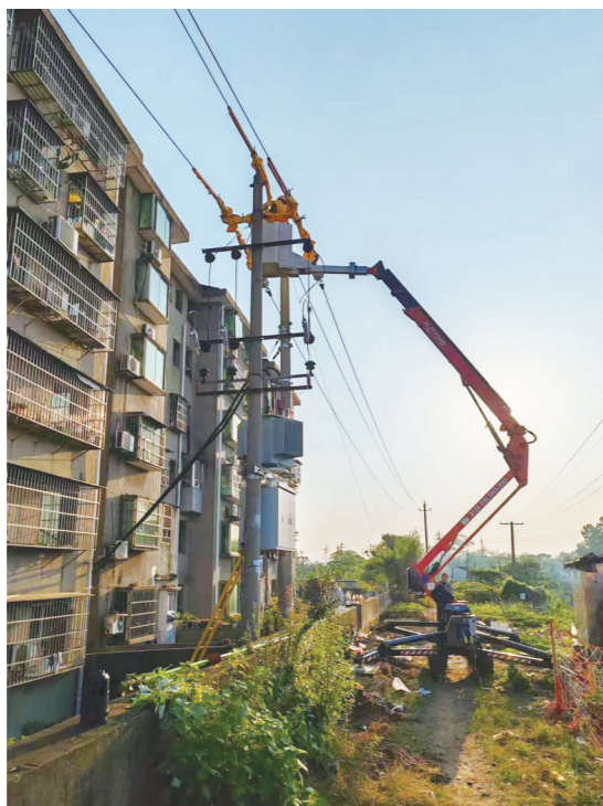
首次在株洲亮相的蜘蛛车。

“蜘蛛车是一种新型履带式带电作业车,因其在作业时将四条支撑腿打出酷似蜘蛛而得名。”国网株洲供电公司相关负责人介绍,这种新型带电作业车能屈能伸、重心低、支撑强,展臂最多可达16米,并且配备了小型履带式底盘,具有良好的机动性与稳定性,能深入狭窄街巷及山林地带进行作业。