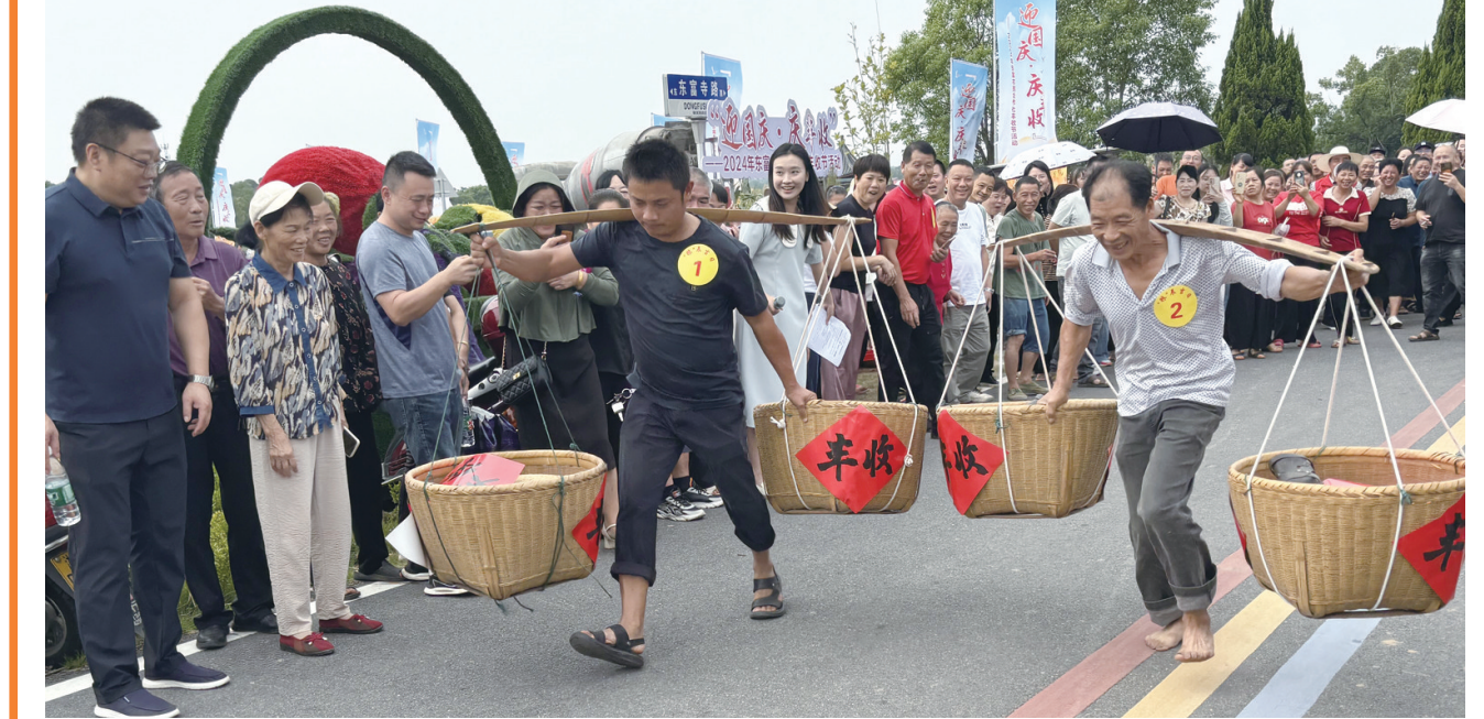
担谷赛跑游戏