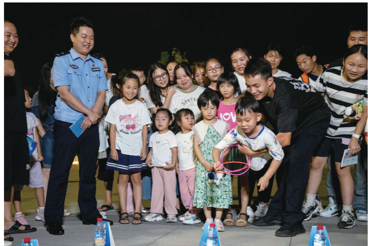
民警携手举行法治宣传夜市。

本报讯(株洲晚报融媒体中心记者/沈全华 通讯员/王斐妮) 9月19日晚上,市公安局石峰分局与石峰区井龙街道办事处联手,开展了一场别开生面的禁毒、反诈、护蕾宣传。