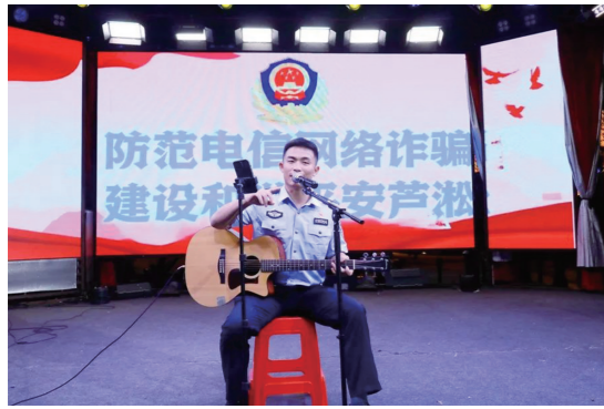
民警演唱改编的反诈版歌曲《再见》。

本报讯(株洲晚报融媒体中心记者/沈全华 通讯员/魏天宇) 9月21日晚上,市公安局芦淞分局推出“巡防+普法”工作模式,将“反诈宣传站”放入芦淞区建宁文化集市,打造“花式”反诈宣传嘉年华。